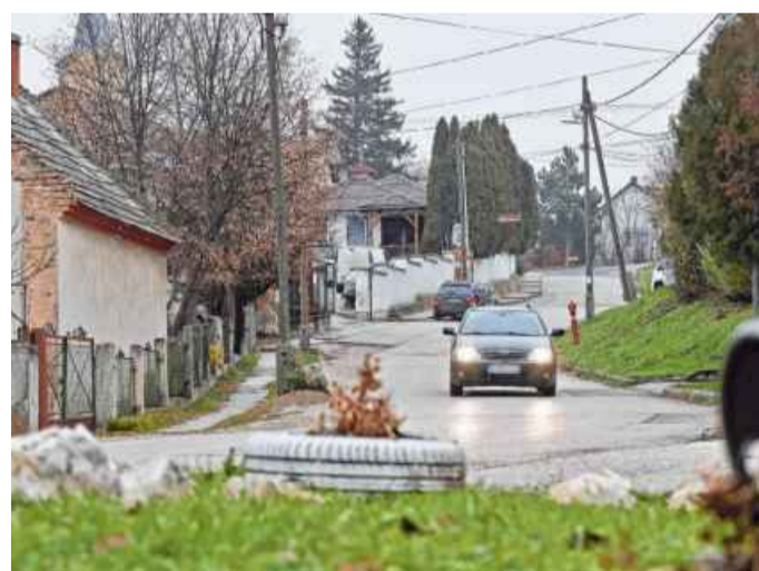
Ha decemberben havazik, már az új traktorral tisztíthatják meg az utakat

A traktor mellé sikerült szintén pályázati pénzből beszerezni egy billenthető pót-